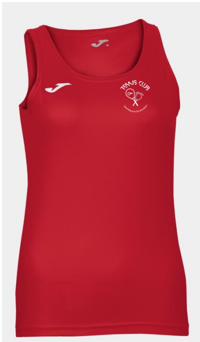
DEBARDEUR JOMA DIANA SEMI-FITTED 100%polyester

PROMO PACK : 3 produits différents même sexe = - 4 €