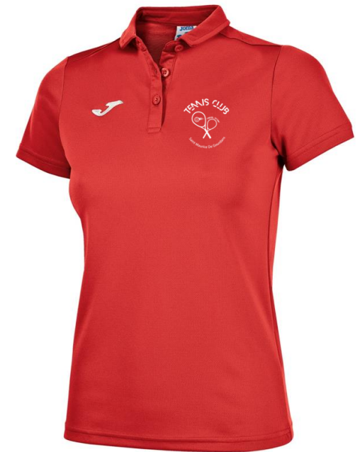
POLO JOMA HOBBY SEMI-FITTED 94%polyester 6%coton