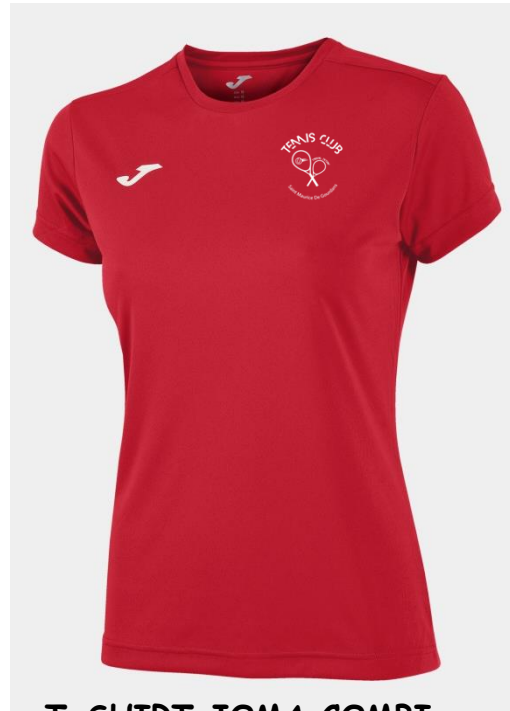
T-SHIRT JOMA COMBI SEMI -FITTED 100% polyester